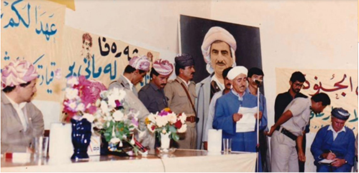
پەيڧا مەلا ياسين رېڭكەنى ل دەمى ھاتتا رېژدار مەسعوود بارزانى بۇ ئامېدىن ۱۹۹۲