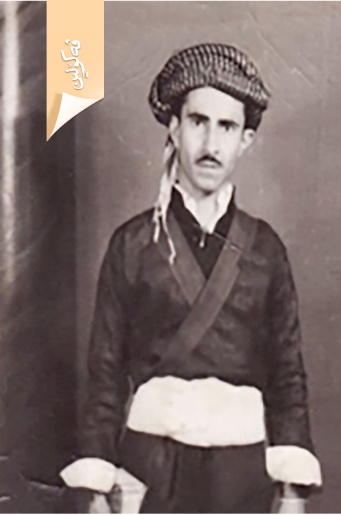
سەیدا د سالیڻ شېستان دا

نەكەن و ل سەر پښازا وی د بەردهوام بن و خزمەتا وهلاتی خو بکەن. سەیدا ژ وان زانایان بوویه پښ کو فیانهکا زیده بو ئاخ و مللەت و وهلاتی خو هەوی و هەردەم ئایین و نەتەوه ل دەف وی وهکی زنجیرهکی بووینە و بو خەلکی ژی وەسا ددا دیارکرن کو چ ژ وان بی یا دیتەر